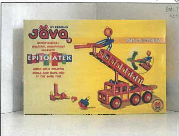
Jáva 5 építőjáték