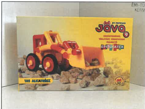
Jáva 9 építőjáték