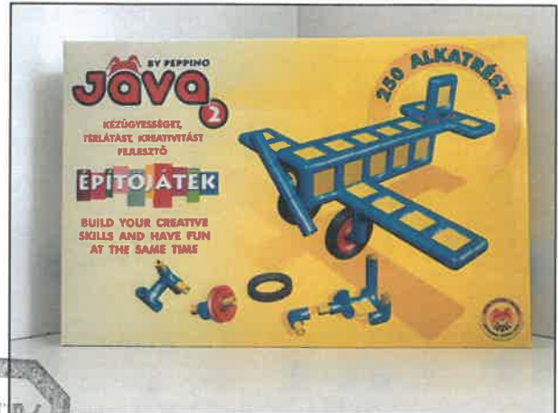
Jáva 2 építőjáték