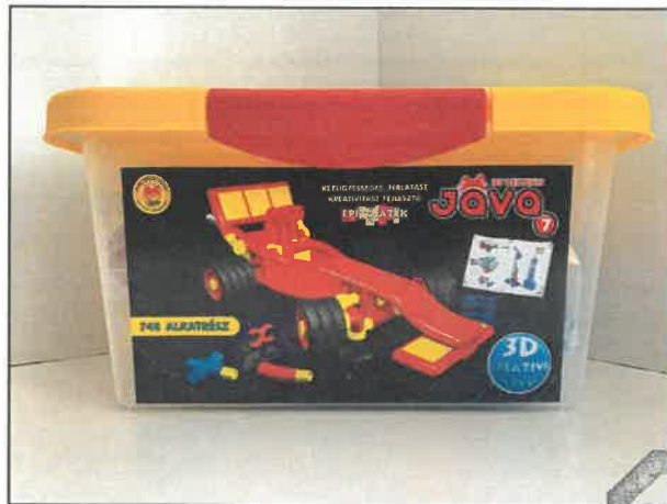
Jáva 7 építőjáték