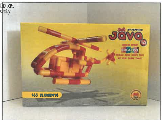
Jáva 10 építőjáték