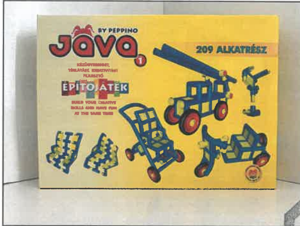
Jáva 1 építőjáték