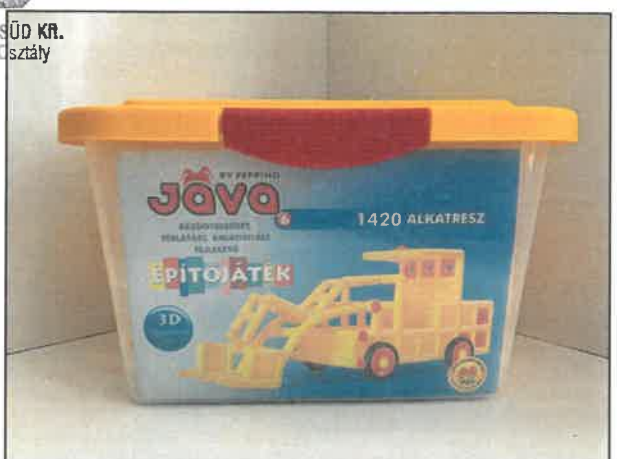
Jáva 6 építőjáték