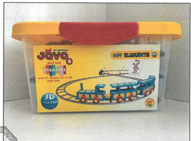
Jáva 8 építőjáték