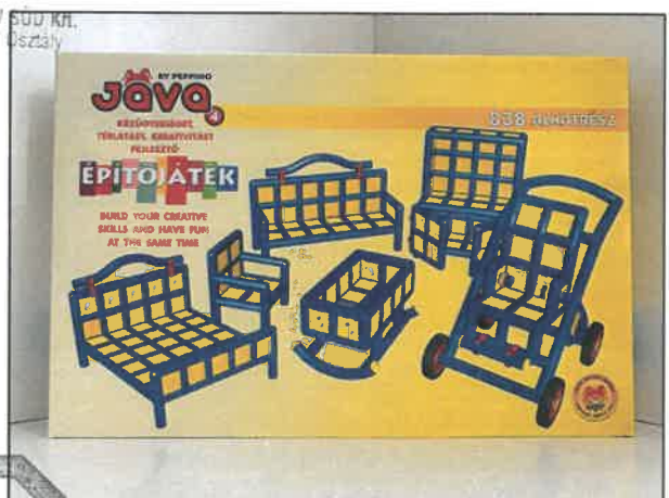
Jáva 4 építőjáték